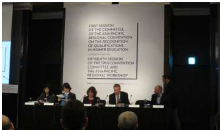
東京規約締約国委員会（第1回）